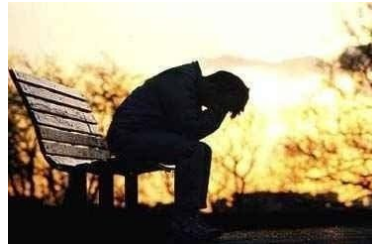
O canto do pássaro, Anthony de Mello